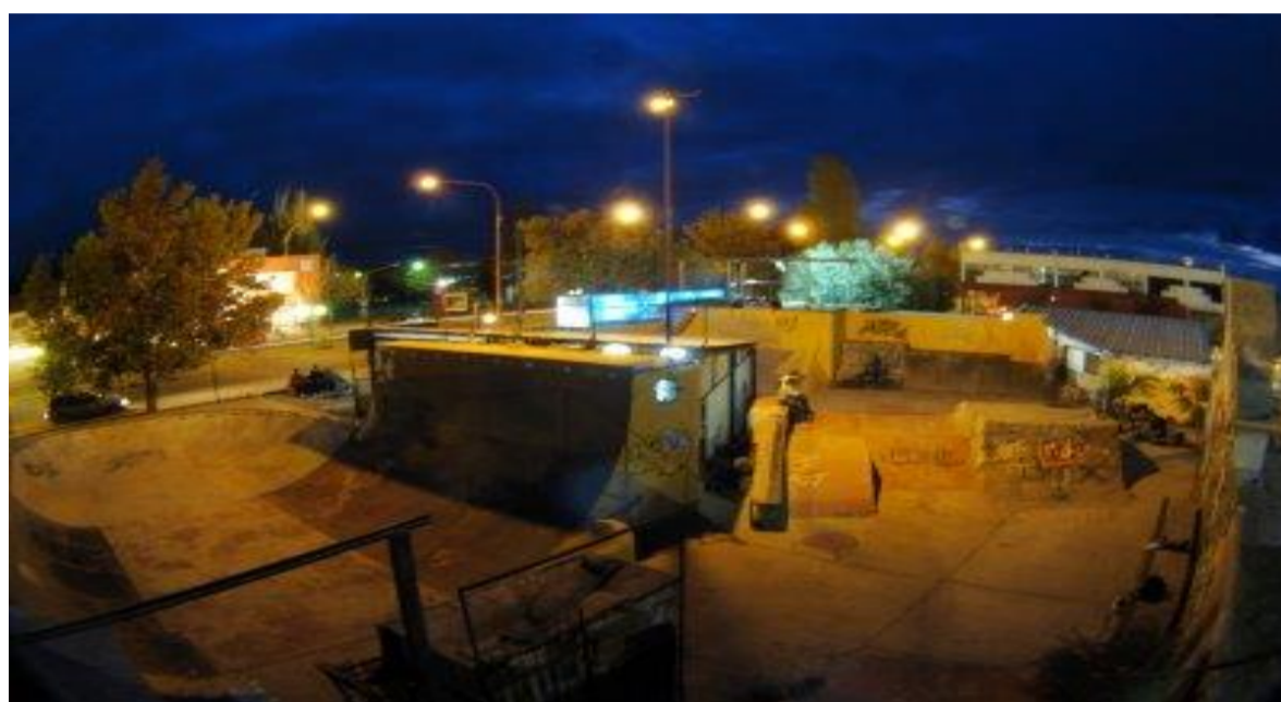
SKATEPARK PÚBLICO, CALIFORNIA, ESTADOS UNIDOS.